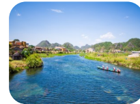
Nivel de ríos y tanques de agua