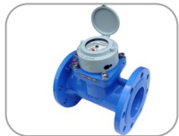
Contadores de riego