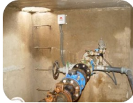
Monitorización de red de abastecimiento de agua