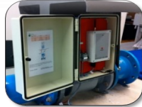
Monitorización de grandes consumidores