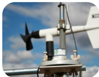
Control de parámetros climáticos