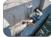
Control de aguas residuales